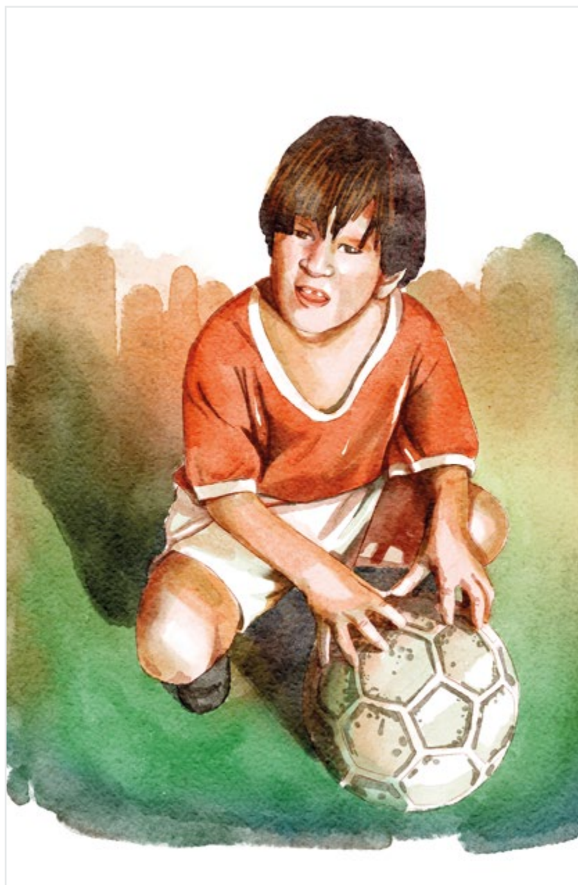
Schilderij van Messi met zijn voetbal als hij 5 jaar is.