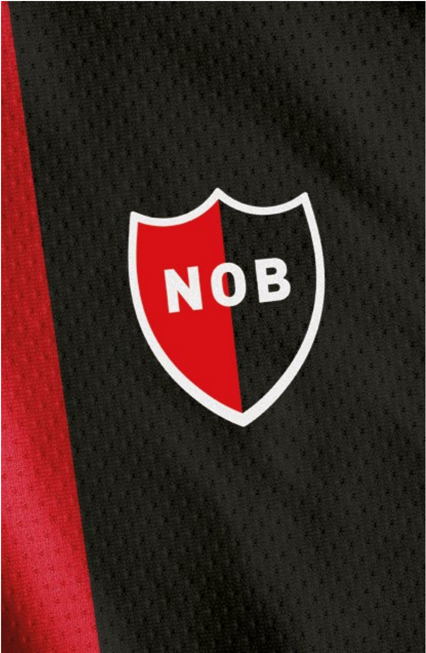
Logo van voetbalclub Newell's Old Boys.