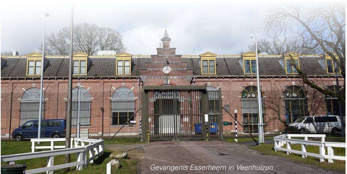
Gevangenis Esserheem in Veenhuizen.

Op gevangenis­museum.nl lees je veel over gevangenis­straf en Veenhuizen. Ook handig voor spreekbeurten!