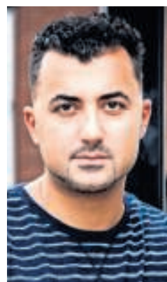
Linksboven een bladzijde uit de roman Turis van schrijver Özcan Akyol (foto onder) en rechtsboven de ‘hertaling’ in een versie voor laaggeletterden. De schrijver is er blij mee: „Het is toegankelijk gemaakt voor een doelgroep die ik met mijn romans anders niet zou bereiken. Ik kan hier niets op tegen hebben.”

Later, toen hij freelance journalist was, werd hem gevraagd te schrijven over verstandelijk gehandicapten. Over. Niet voor. Dat idee kwam daarna. „Dan schrijf je over emancipatie van deze men-