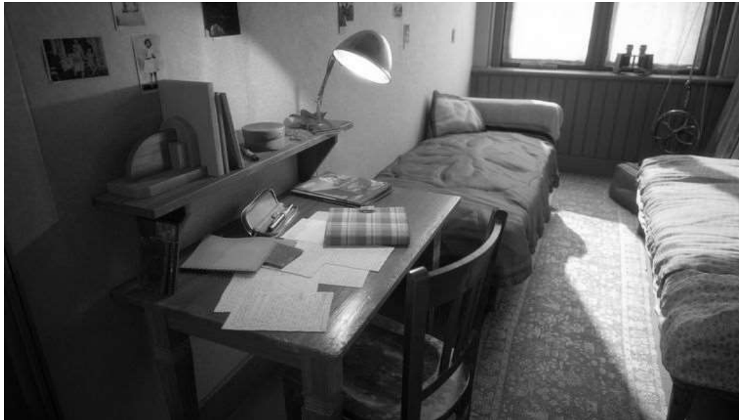
De slaapkamer van Anne Frank in het Achterhuis in Amsterdam.

Het boek is sinds woensdag 21 april verkrijgbaar online en in boekhandels.